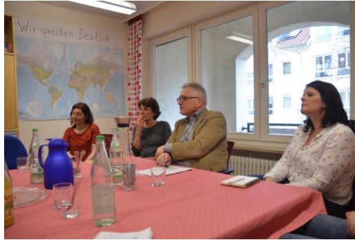
Im Gespräch mit alleinerziehenden Müttern

Am Mittwoch der vergangenen Woche besuchte ich wie bereits erwähnt das Mehrgenerationenhaus in Markdorf. Neben dem Treffen mit der Gruppe alleinerziehender Mütter, aus welchem ich wichtige Impulse mit nach Berlin nehmen konnten, nutzten auch zahlreiche Bürger die Gelegenheit mit mir ins Gespräch zu kommen. Die Möglichkeit zu einem Gespräch unter vier Augen biete ich in regelmäßigen Abständen in unterschiedlichen Städten und Orten meines Wahlkreises