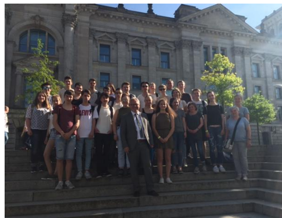
Mit der 10. Klasse der Bodenseeschule vor dem Reichstagsgebäude

Generell versuche ich, alle Schulklassen und Besuchergruppen im Rahmen eines persönlichen Gesprächs über meine Arbeit zu informieren und mit den Teilnehmern über aktuelle Themen zu diskutieren. Aufgrund eines Berichterstattergesprächs konnte ich die Klasse 10 der Bodenseeschule allerdings nur kurz beim Essen im Paul-Löbe-Haus treffen.