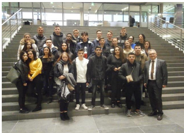
Die Klasse aus Friedrichshafen im Paul-Löbe-Haus

Heute hatte ich mit der diesjährigen Abschlussklasse der Gemeinschaftsschule Schreienesch in Friedrichshafen die erste Schulklasse in diesem Jahr zu Besuch in Berlin. Direkt im Anschluss an die Fraktionssitzung konnte ich die Schülerinnen und Schüler im Paul-Löbe-Haus zu einem Gespräch und einer Diskussion über aktuelle Themen begrüßen.