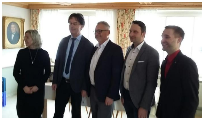
Beim Funkensonntag in Kressbronn-Gatt nau

Die traditionelle Veranstaltung der CDU Kressbronn am Funkensonntag stand dieses Jahr ganz klar im Zeichen des Koalitionsvertrags. Im gut besuchten Landgasthof „Rössle“ in Gatt nau ging ich deshalb auf die Details der Ergebnisse der Koalitionsverhandlungen ein. Anschließend folgte eine muntere Diskussion mit den anwesenden CDU-Mitgliedern, in welcher auch Kritik an einigen Punkten des Papiers laut wurde.