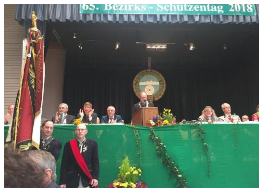
Auf dem Bezirksschützentag in Obereisenbach

Vor gut 10 Tagen war ich zu Gast beim 65. Bezirksschützentag der Schützenvereine im Bezirk Oberschwaben in Tettang-Obereisenbach. In meinem Grußwort ging ich auf die Bedeutung der Schützenvereine ein und hob insbesondere den Aspekt der Konzentrationsfähigkeit hervor. In unserer immer schneller werdenden Welt ist es eine absolut wünschenswerte Fähigkeit, sich einfach auf nur eine Sache konzentrieren zu können!