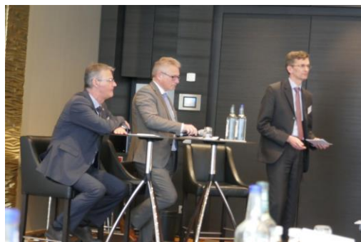
Auf dem Podium der VKD-Frühjahrstagung

In regelmäßigen Abständen treffen sich die baden-württembergischen Krankenhausedirektoren und Geschäftsführer zu einem Austausch untereinander und mit Vertretern der Politik. So auch an diesem Montag, als ich in Leinfelden-Echterdingen Stellung zu den gesundheitspolitischen Regelungen des Koalitionsvertrags nahm und mich anschließend in einer gemeinsamen Diskussion mit dem neuen Präsidenten der Deutschen